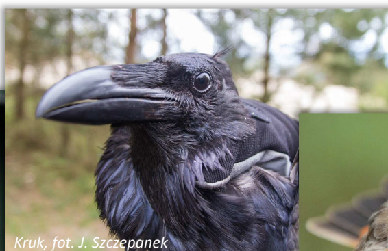
Kruk, fot. J. Szczepanek