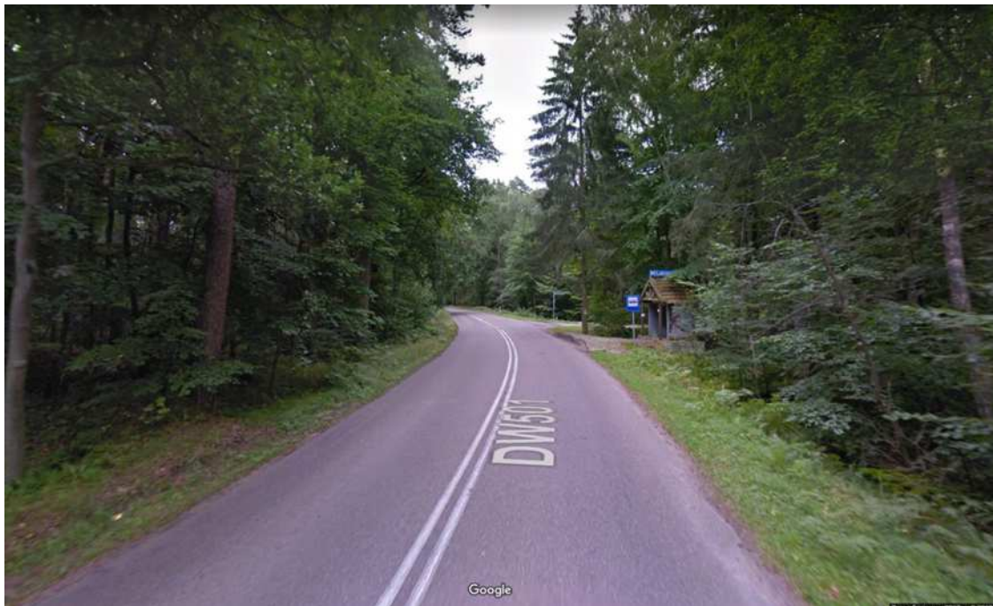
Tak wygląda przystanek SIEKIERKI

Po opuszczeniu autobusu należy skręcić w prawo w drogę z betonowych płyt i iść nią do pierwszego domu. Po dojściu do domu skręcamy w lewo w leśną ścieżkę i nią po ok. 600 m dochodzimy do obozu. Całe przejście zajmuje ok. 15-20 minut.